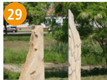
29 Einer neben den anderen/Duo - jedan uz drugoga