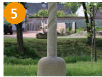
5 Bohrer - svidar