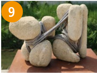
9 Faszination Unterbewusstsein - fascinacija podsvisti