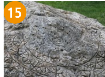
15 Siegel - pečat