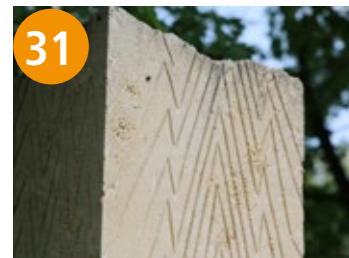
31 Vibration - vibracija