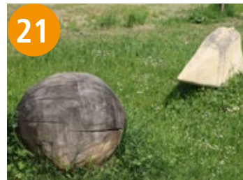
21 Treffen - zastanak