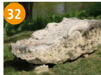
32 Sandsteinbank - kominac