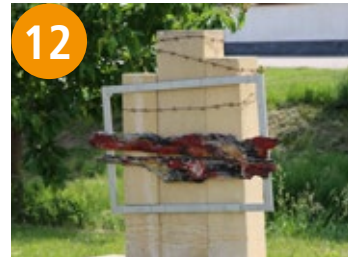
12 Erinnerung - spominak