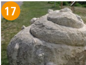
17 Gruppe von Schnecken - grupa pužev