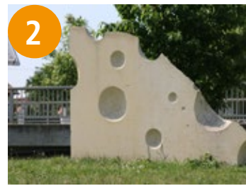
2 Stück Käse - kusić sira