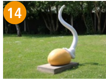
14 Weizenkorn - pšenično zrno