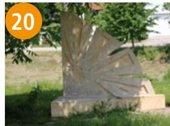
20 Sonne - sunce