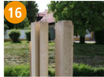
16 Freundschaft - prijateljstvo