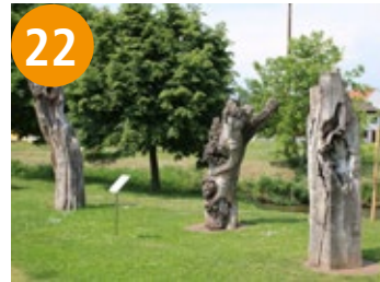
22 Drei Maulbeerbäume - troja stabla murve