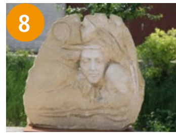
8 Blick in eine gute Zukunft - pogled u dobru budućnost