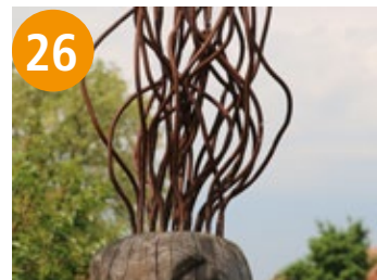
26 Kerze - svića