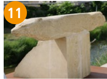
11 Pünktliche Treffen - točni zastanki