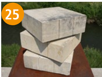
25 ALEA IACTA EST