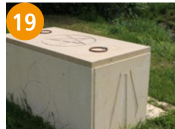
19 Identity box - škrablja identitete