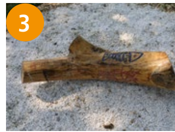
3 Zeit-Feldarbeit - vrimensko-poljsko djelo