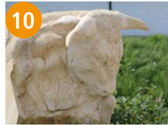
10 Stier - bak