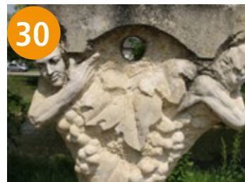
30 Traube - čehuljak