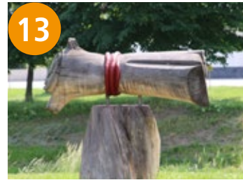
13 Garbe - snop