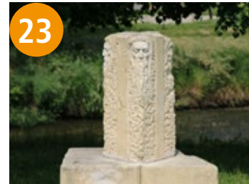
23 Vier Evangelisten - četiri evandjelisti