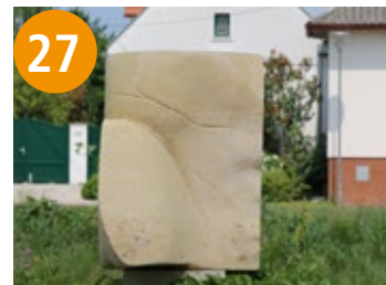
27 Karte der Seele - karta duše