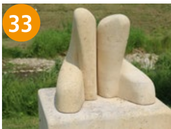
33 Im Licht der Sonne - u svitlosti sunca

Detaillierte Beschreibungen der einzelnen Skulpturen finden Sie auf unserer Homepage unter