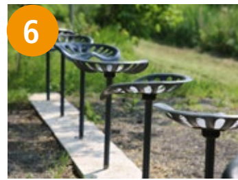
6 Sieben Sitze - sedam sidala