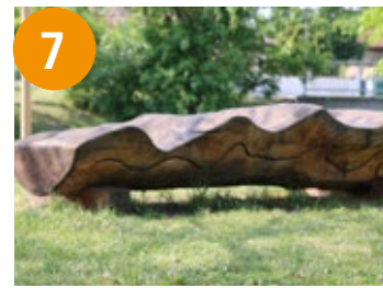
7 Wasser - voda